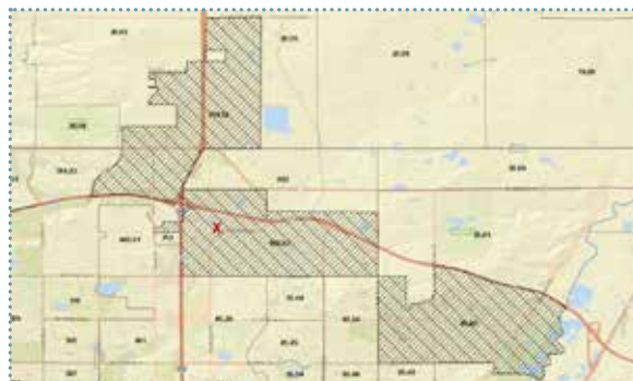
Vị trí dự án đáp ứng các yêu cầu về TEA theo quy định của USCIS

Các hoạt động phát triển Dự án đã khởi công vào Quý 3, 2023. Dự án dự kiến hoàn thiện vào Quý 1, 2025.